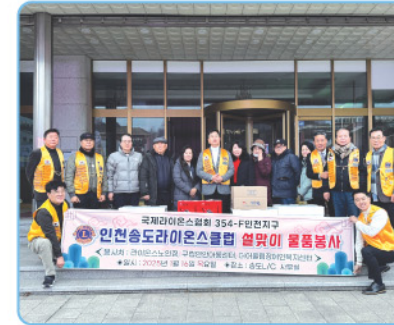
▲ 송도라이온스클럽 - 설 명절맞이 후원