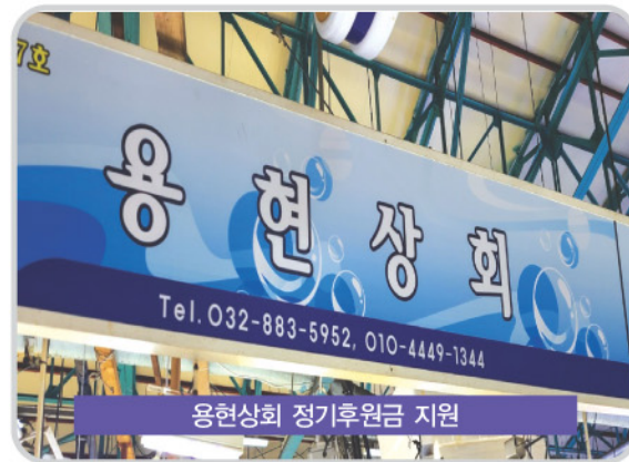
용현상회 정기후원금 지원