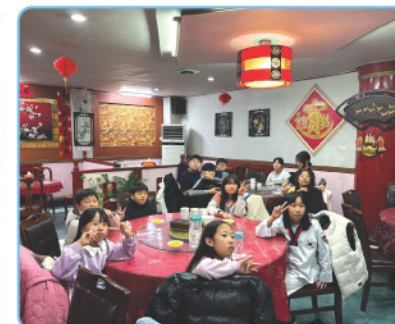
▲ CJ 제일제당 제2공장 - 짜장면 후원