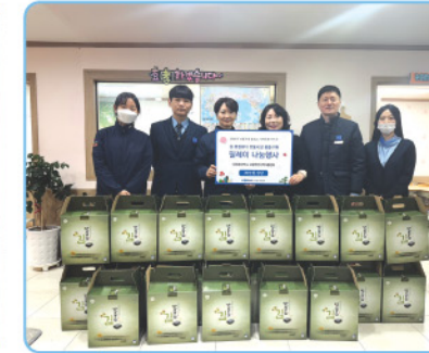
▲ 인천역 - 설 명절맞이 후원