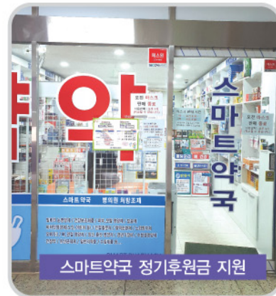
스마트악국 정기후원금 지원