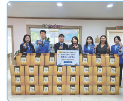
▲ 인천역 - 추석 명절맞이 후원