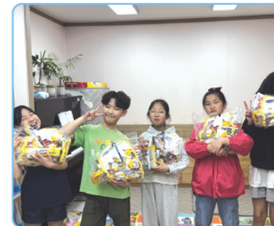
▲ 사랑의 네트워크 - 어린이날 과자 후원