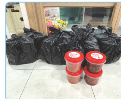
▲ 연안동 주민센터 - 반찬 후원