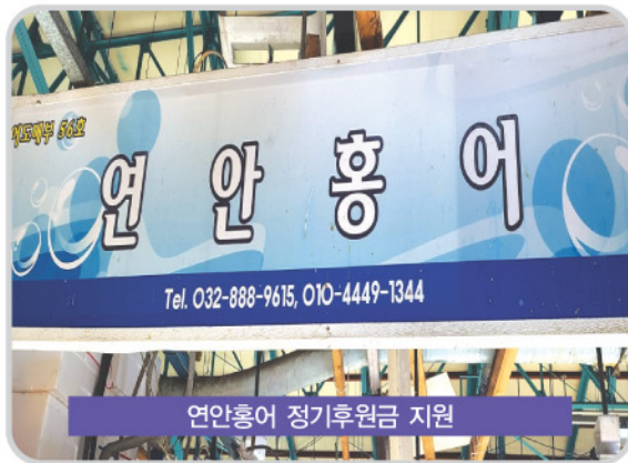
연안홍어 정기후원금 지원