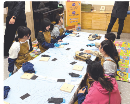
목공예 - 시계만들기