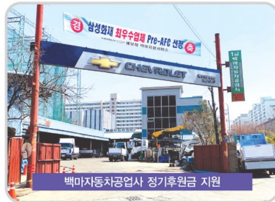
백마자동차공업사 정기후원금 지원