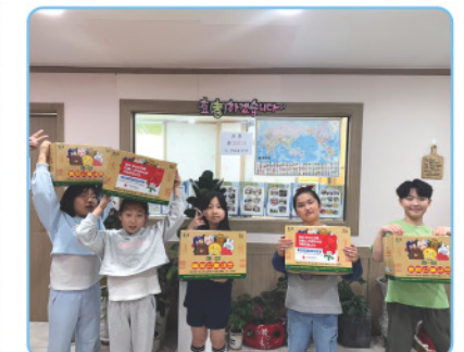
▲ 연안동 지역사회보장협의체 - 어린이날 과자 후원