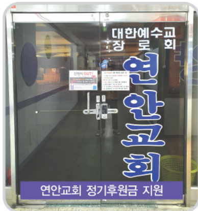
연안교회 정기후원금 지원