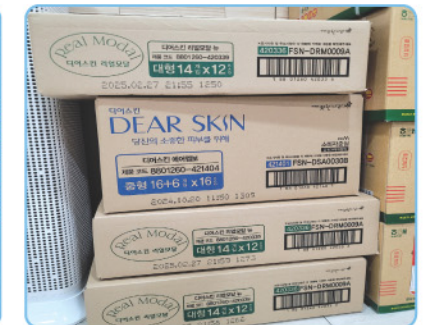
▲ 굿네이버스 - 여성용품 후원