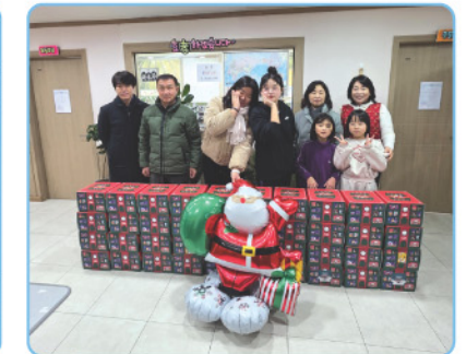
▲ 자원봉사센터 - 크리스마스 케이크 후원