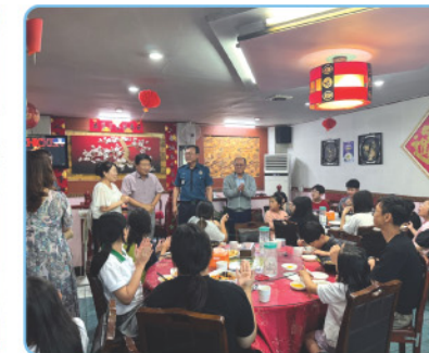
▲ 연안동 생활안전협의회 - 짜장면 후원