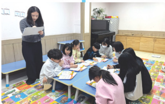
건강한 돌봄놀이터 - 영양