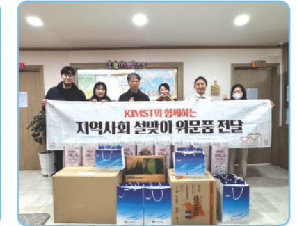
▲ 해양수산과학기술진흥원 - 설 명절맞이 후원