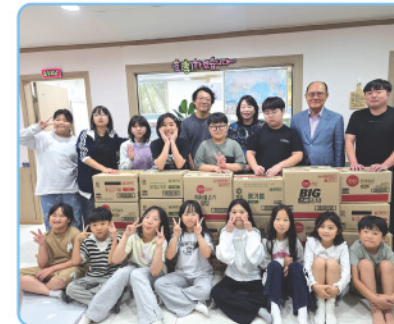
▲ CJ 제일제당 제2공장 - 추석 명절맞이 후원