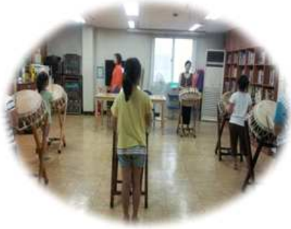
< 두드림 난타 >