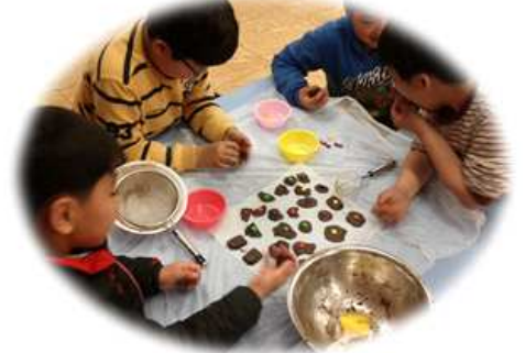
< 요리교실 >