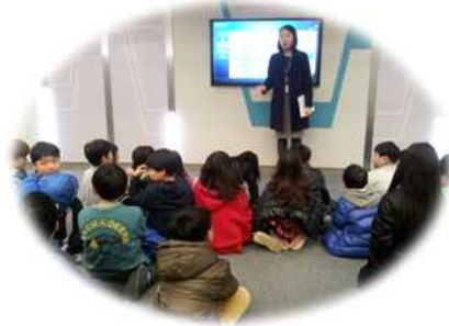
< 증권거래소 견학 >