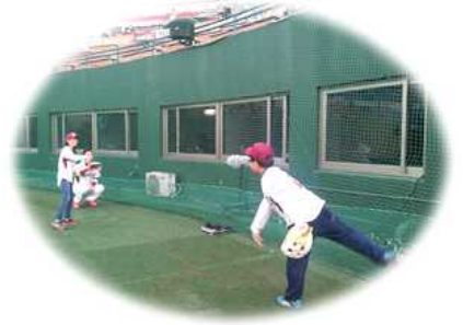
< 목동 넥센 히어로즈 시구·시타 >