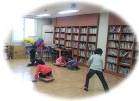
< 심리 놀이 운동 >