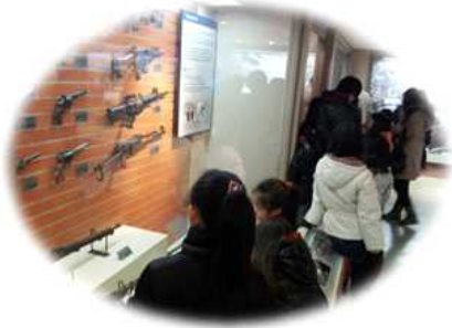
< 경찰박물관 견학 >