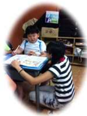
< 숙제지도 >