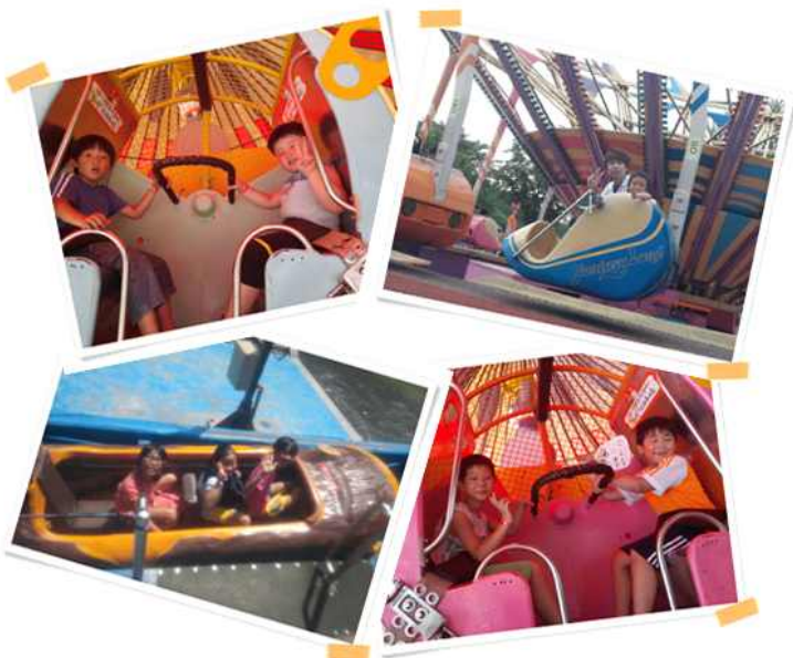
서울랜드에서 물총놀이 후에 즐기는 놀이기구