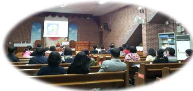
< 2012년 부모교육 >